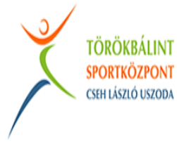
Törökbálinti Sportközpont Cseh László uszoda