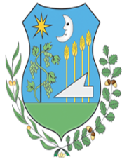
Törökbálint város önkormányzata