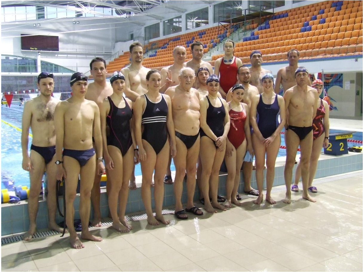
Ugyanaz 6 mp-cel később, hogy a lelátó is benne legyen a képben 18:23:40