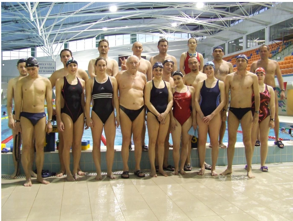
Majdnem minden résztvevő a csapatképen 18:23:34