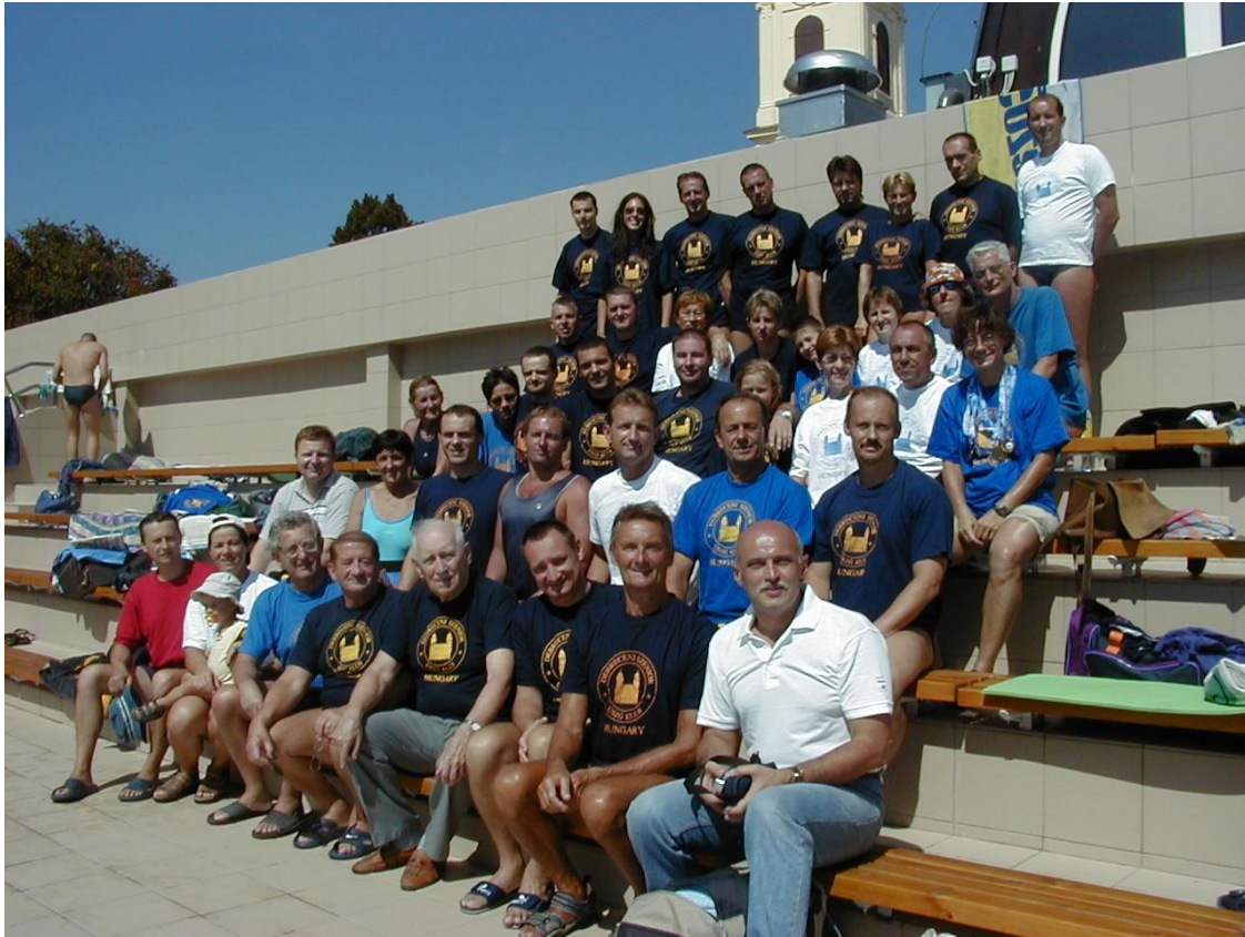
Számos volt tanítványa jelenleg is aktív szenior versenyző