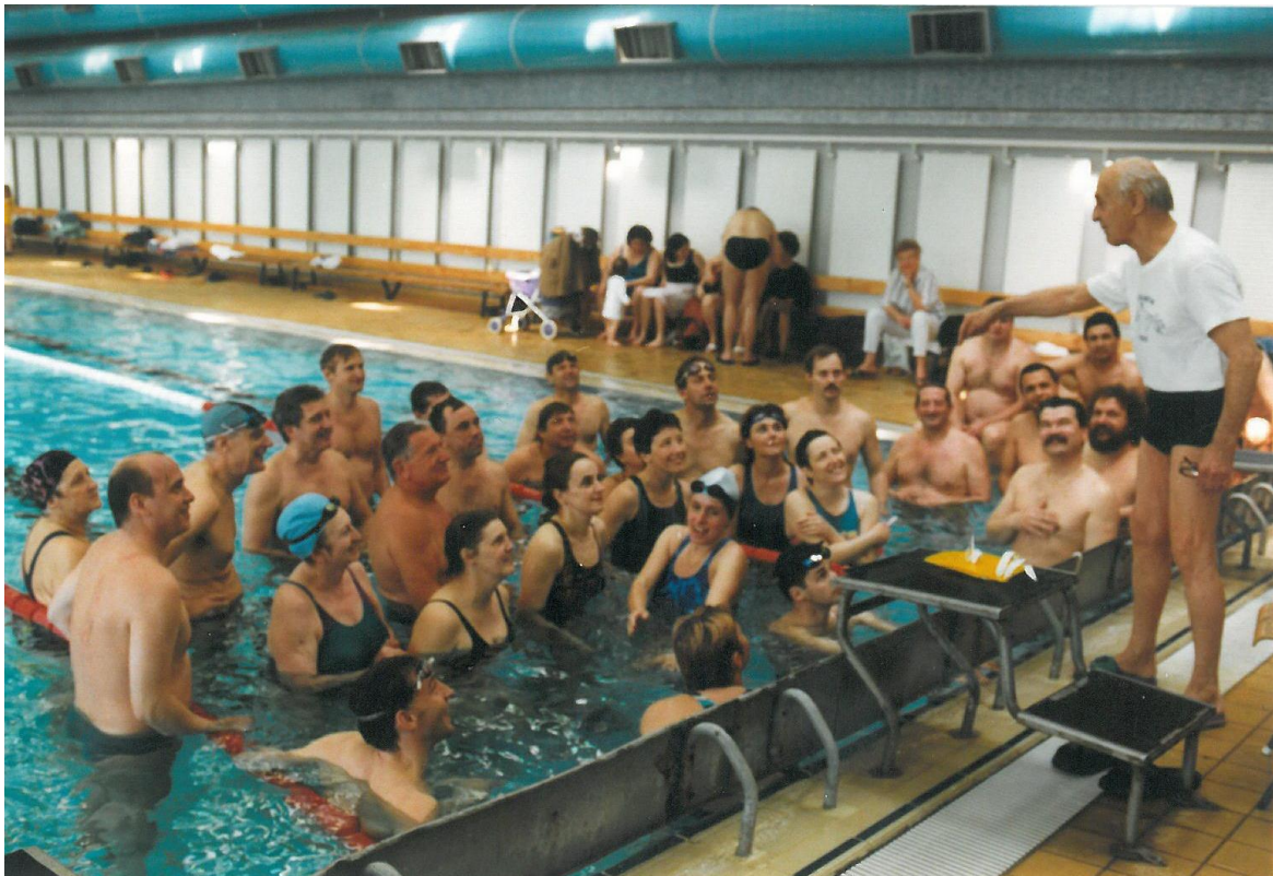
75. születésnapján nosztalgia edzést tartott az egykori tanítványoknak.