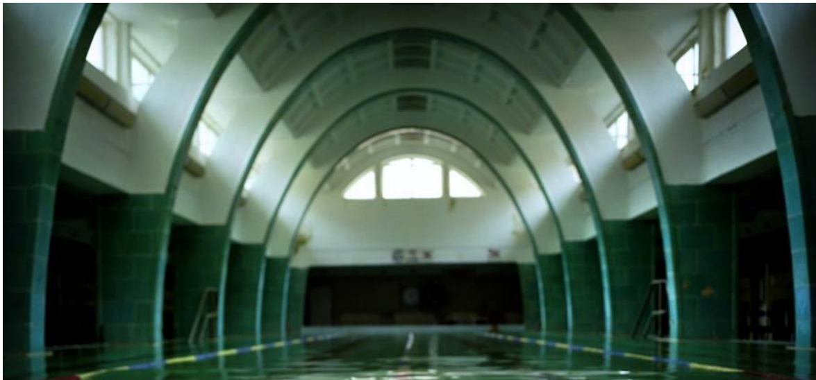
A „33 méteres” Fedettuszoda