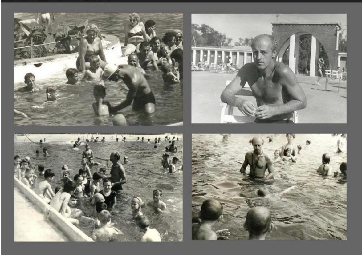
Csoportos úszásoktatás a „langyos” medencében.