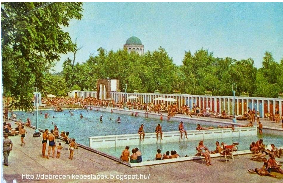
Ilyen volt az 50 + 10 méteres medence. Háttérben a Víztorony.