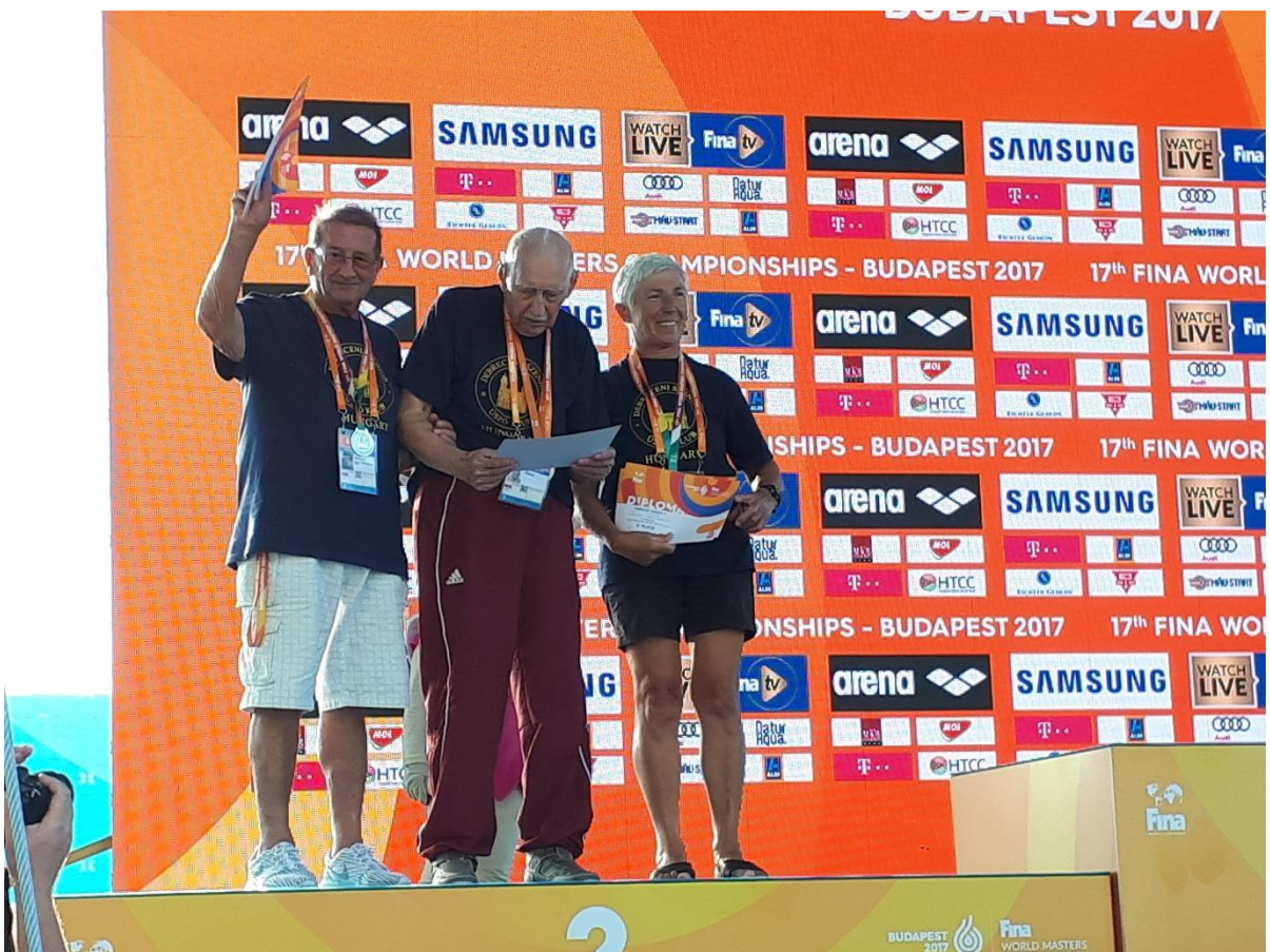
A világ tetején... Az ezüstérmes debreceni váltó három tagja a dobogón.