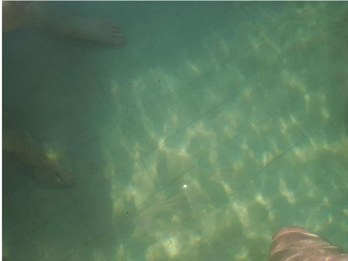
A víz ilyen átlátszó volt, a medence alján táncolt a napsugár... (Véletlenül készített fotó...)